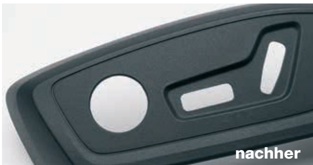
Autositzblende ohne / mit G-Coat – Kaschierung von Bindenähten

Mit unserer innovativen Technologie G-Coat optimiert: Seitenverkleidung für Autositze – frei von Bindenähten dank der richtigen Werkzeugbeschichtung